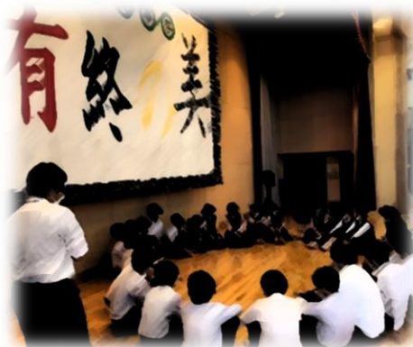
蓮華祭を振り返る役員の生徒たち

3年生が全校をリードして行われた蓮華祭が大成功に終わった(右写真)のも束の間、関西方面への修学旅行の実施と進路実現に向けた取り組みと、様々なことを同時にこなさなければならない中にも“充実感”が感じられます。