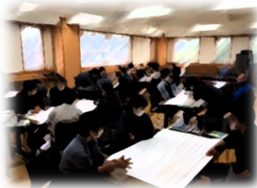
職員研修グループワーク

毎月行われる職員会においても、研修の時間が位置づけられており、研修を深めています。今後も、あらゆる視点から研修を継続し、職員一人ひとりの資質向上に努めてまいります。