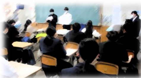
役員候補による学級訪問の様子

蓮華祭が幕を閉じ、選挙管理委員会が発足しました。来年度の生徒会役員選挙に向けて、今週から教室訪問も始まりました。9名の候補者のどの公約にも、生徒会を引き継ぐ自覚とやる気が集約されています。以下に紹介します。